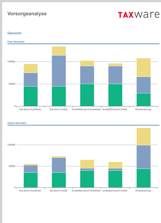
Die wichtigsten Zahlen und Grafiken auf einen Blick

Nicht immer ist auf den BVG-Leistungsausweisen ersichtlich, ob noch ein Einkaufspotenzial vorhanden ist. Mit diesem Rechner ist das im Handumdrehen gemacht. Bestehende Guthaben aus 2. und 3. Säule werden selbstverständlich berücksichtigt.